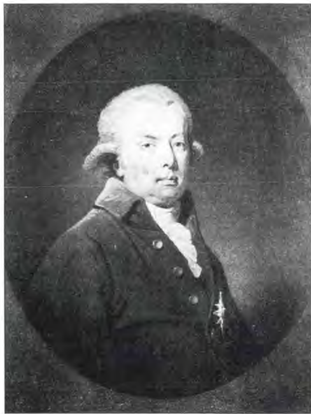
Stadhouder Willem V

vrijkorpsen, zich ook tegen stadhouder Willem V. In 1784 kwamen er steeds meer incidenten tussen oranjegezinde menigten en vrijkorpsen. Tussen 1784 en 1786 ontstond er in Utrecht steeds meer verwijdering tussen de regenten en de vrijkorpsen. De regenten dachten de vrijkorpsen te kunnen inkapselen, maar de laatste gingen steeds meer hun eigen gang. Ze konden dit ook doen aangezien de vrijkorpsen er meer dan welk lid van de benoemde vroedschap ook aanspraak op kon maken de Utrechtse bevolking te vertegenwoordigen. Onder druk van de straat stond de vroedschap inmenging van de patriotten toe, maar in maart 1785 werd dit door de Staten van Utrecht weer terug gedraaid. In juni was er een bijeenkomst op de Neude van duizenden vrijcorporisten uit bijna alle provincies en werd door alle aanwezigen de 'Akte van Verbintenis' gezworen. Het was de eerste collectieve, nationale verklaring van de politieke doelstelling der vrijkorpsen. Na aanvankelijk verzet werden uiteindelijk op 2 augustus 1786 de resterende raadsleden in Utrecht vervangen door nieuwe vertegenwoordigers. De nieuwe patriottistische raad vormde samen met Montfort en Wijk bij Duurstede de (patriottistische) Staten van Utrecht. De oude Staten hadden zich teruggetrokken in Amersfoort. Na rellen in Den Haag tussen vrijkorpsen uit Leiden en