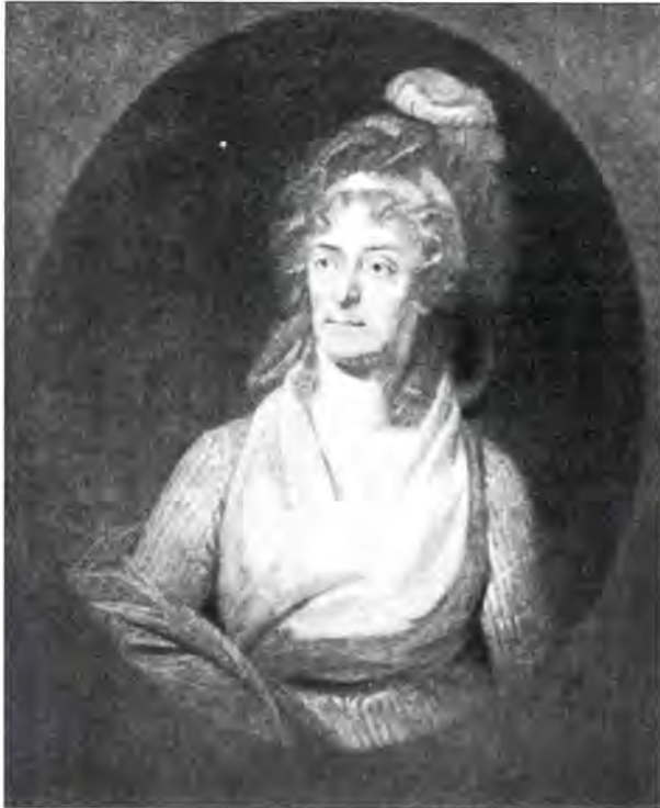
Wilhelmina van Pruisen

en dat was uiteraard een buitengewoon vernederende ervaring. De broer van Wilhelmina, Frederik Willem, koning van Pruisen, was woedend en eiste in een ultimatum aan de Staten-Generaal onmiddellijke invrijheidsstelling van de prinses, haar vrije intocht in Den Haag en bestraffing van de schuldigen. Op 30 juni keerde Wilhelmina overigens ongedeerd weer naar