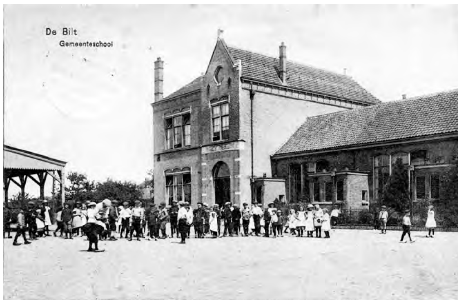
De Tuinstraatschool in 1884. Hier repeteerde het koor de eerste decennia van haar bestaan. De Tuinstraat kreeg later de naam Jasmijnstraat. De school heet sinds 1958 de Theo Thijssenschool. In 1993 werd dit opnieuw het repetitie-adres van Zang Veredelt.

bestond voornamelijk uit vierstemmig, Nederlandstalig repertoire. De Biltsche Zangvereniging was een gemengd koor. Onder leiding van meester Van Leeuwen ging het voortvarend van start en al op 12 oktober