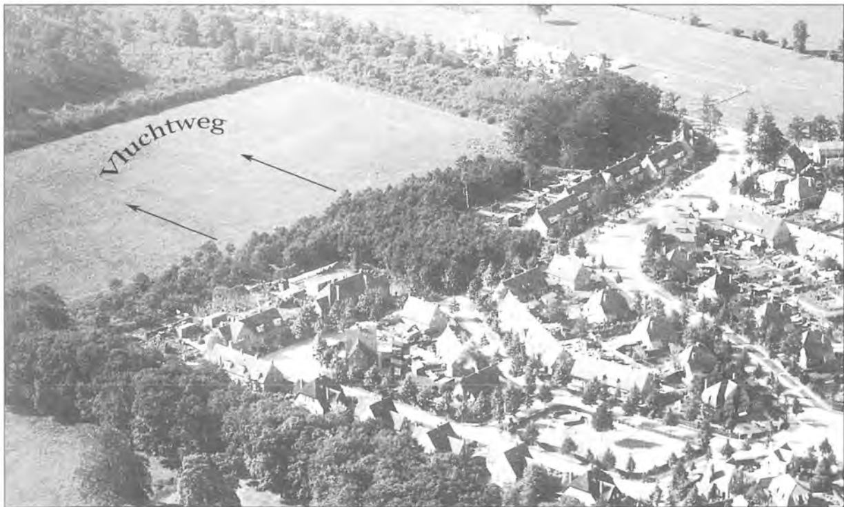
Luchtfoto van de plaats van de ramp. Deze is een gedeelte van een in 1932 door KLM Aerocarto genomen foto. Bij de pijlen het open weiland dat de vluchtelingen voor de in Jagtlust gevestigde SS-ers duidelijk zichtbaar maakte.

die omvang plaatsgevonden, terwijl hierbij drie ambtenaren van de gemeente De Bilt omkwamen. Het moet zeker overwogen worden om bijvoorbeeld naast het algemene gedenkteken een apart gedenkteken ter nagedachtenis aan de slachtoffers van deze gebeurtenis te plaatsen.