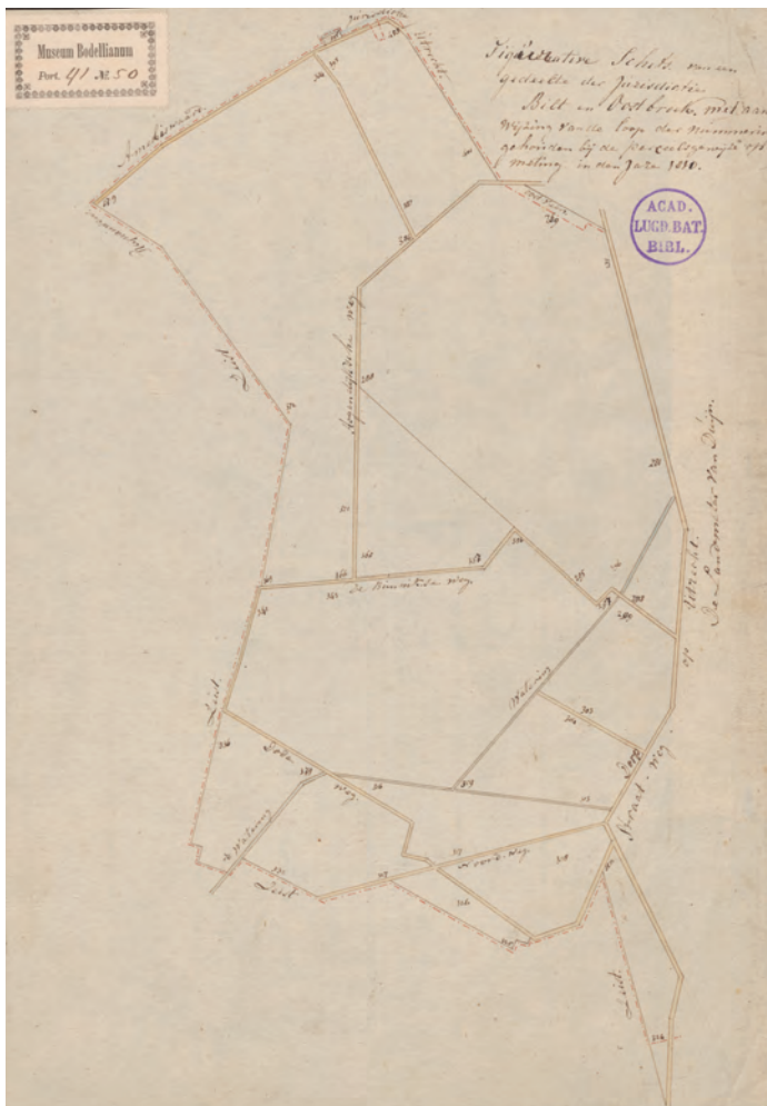
Afbeelding 16, blz. 26

het woord "Dorp", iets verderop. De Bunnikseweg kruist dan de Watering (=Biltse Grift) over het ook nu nog rustieke bruggetje en komt dan na twee hoeken op het stuk, dat nu als fietspad naast de Universiteitsweg ligt.