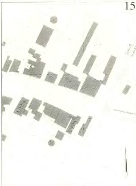
Detail van de kadastrale kaart nummer 15, opgemaakt in 1832. Sectie D 236 betreft Staten Wapen (in 1832 Koopmans Welvaren geheten), sectie D 235 t Wapen van Schotland (in 1832 De Zwaan genoemd), sectie D 227b de Spieringweg en sectie B 96 de Houderingervaart .