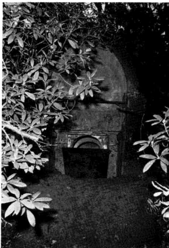
Particuliere grafkoepel van de familie Eyck van Zuylichem aan de Koekoeklaan (eens bewoners van huize "Eyckenstein" aan de Maartensdijkseweg in de gemeente Maartensdijk)

In de bossen ten noorden van de Maartensdijkseweg aan de Koekoeklaan aldaar (niet te verwarren met de Koekoeklaan omgeving Kwinkelier) bevindt zich de particuliere grafkelder van de familie Eyck van Zuylichem.