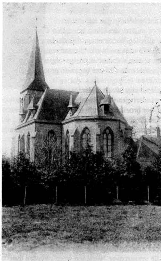
R.-K. St.-Michaëlkerk aan de Kerklaan te De Bilt omstreeks 1902.