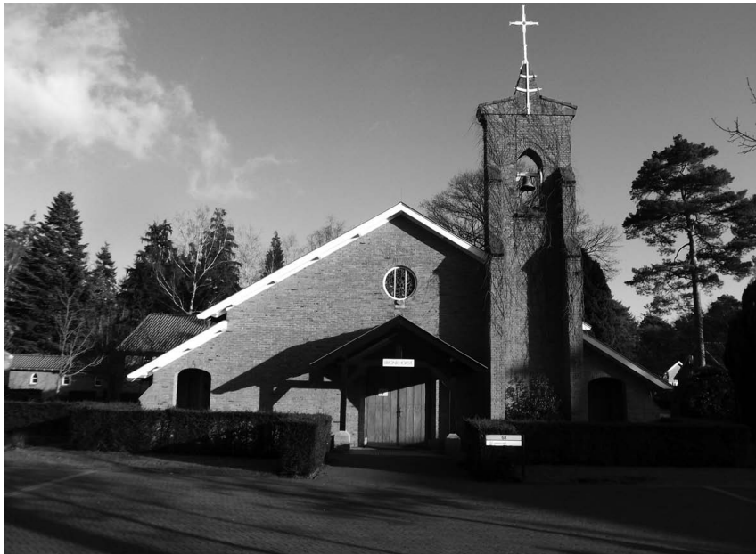
Kapel Berg en Bosch.