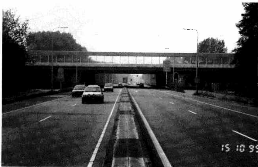
De Utrechtseweg , gezien in de richting Utrecht, oktober 1995.

Bekijken we nogmaals het kaartje van 1641 dan zien wij, dat, waar men nu de Soestdijkseweg-zuid vindt, de naam Spiring Wech staat. Volgens de heer J.W.H. Meijer, schrijver van het boek Kleine Historie van De Bilt en Bilthoven , komt spi(e) van spieden en ring zou volgens hem route betekenen. De Spiring Wech zou dus een route kunnen zijn, die de dragonders aflegden wanneer zij hun ronde deden om te zien of alles op het platteland veilig was.