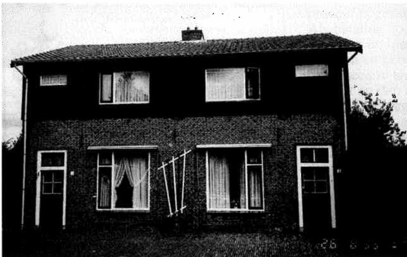
Twee woningen aan de Oude Bunnikseweg 1 en 3, in 1776 gebouwd in opdracht van de heer Fredrik Jan van Westreenen. (foto augustus 1995)

wijs' door de belendende perceelseigenaren opgebracht te worden. Blijkens de Biltse resolutieboeken vond de schouw doorgaans tweemaal per jaar plaats, meestal in mei en oktober. Opmerkelijk is, dat niet alleen de wegen en de weteringen werden geschouwd, maar ook was er veelvuldig sprake van het schouwen van de ekster- en kraaiennesten. In de gerechtsnotulen van 11 mei 1768 werd vermeld: 'Sijn geschouwen de exter en kraynsten mitsgaders de weteringen