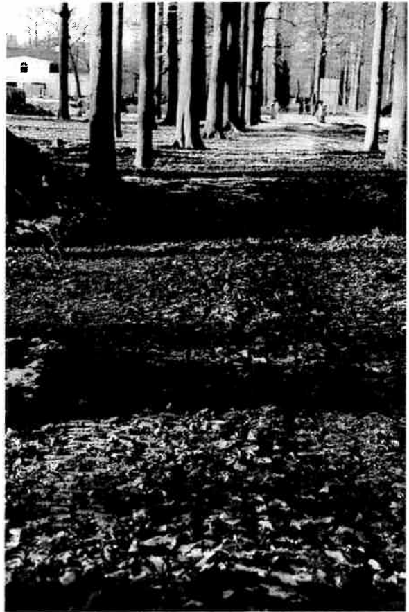
De verlegde Looijdijk (Melkweg), aangelegd in opdracht van mevrouw de weduwe De Smeth, gezien in westelijke richting. (foto december 1998)