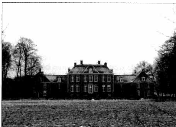
De achterzijde van het huis Houdringe, gezien vanaf de Visserssteeg. Het middengedeelte werd gebouwd in 1779. Een steen met de initialen Ph vW Ao 1779 (Pieter Heronimus van Westrenen) bevindt zich in de voorgevel. (foto januari 1999)

De heer J.W.H. Meijer, schrijver van Kleine Historie van De Bilt en Bilthoven zei bij navraag, dat het mogelijk kan zijn, dat destijds de Groenekansewetering verder doorliep en zich wellicht ook bevond ten noorden van de Visserssteeg. Deze wetering is thans nog wel op Maartensdijks grondgebied te vinden aan de noordzijde van de Groenekanseweg.