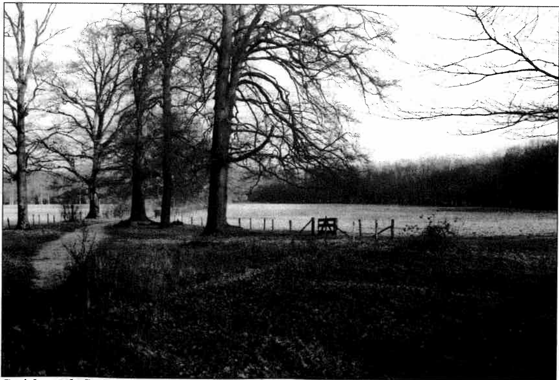
Gezicht op de Spijkerkamp vanaf de knik in de Visserssteeg in noordelijke richting. Links het Amersfoorts voetpad. (foto december 1999)