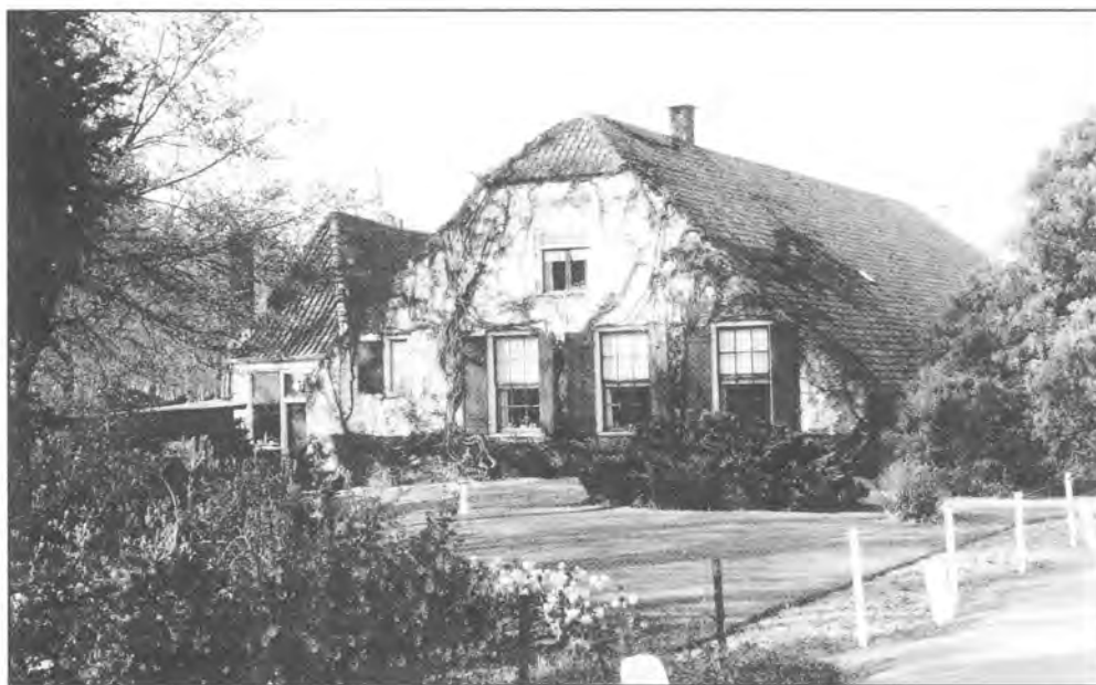
Boerderij "Den Hoek", Bisschopsweg 2. Links bakhuis. Foto: Jan van der Heijden, 1990

Op 15 oktober 1799 werd er tijdens de vergadering weer gemeld dat er geschouwd was. Door Cornelis Stam werd gerapporteerd dat er veel mis was bij de wetering die langs de noordzijde van de Steenstraat liep. Diverse eigenaren hadden hun slagen naast gemelde wetering, die wel de Molenwetering werd genoemd, niet naar behoren verzorgd. Een slag was zelfs 'geheel ongemaaft'. Men wist niet wie daarvan de rechtmatige