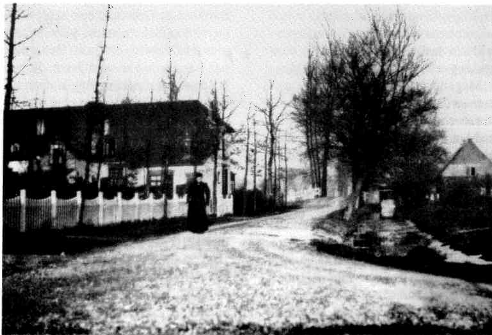
De ansichtkaart waarop bij nader inzien niet Bureveld 3 te zien is, maar de achterzijde van de woningen Oude Bunnikseweg 2 en Emmalaan 12 en 13.

In het gebied ten zuiden van de Utrechtseweg komt de naam Bureveld terug in maar liefst vijf namen van boerderijen. Er is een Bureveld 1, Bureveld 2, Bureveld 3, Nieuw Bureveld en Bureveld. Bureveld 1 en 2 en Nieuw-Bureveld bestaan nog steeds. De eerste is te vinden op het adres Universiteitsweg 12, dat zich halverwege het fietspad naar De Uithof aan een zijweggetje bevindt. Bureveld 2 is de dwarshuisboerderij aan de Bunnikseweg 10, terwijl Nieuw Bureveld de boerderij is waar in 1993 het startpunt was voor de boerderijtocht op Open Monumentendag. Hij is gelegen aan de Universiteitsweg 1, schuin tegenover het tuincentrum. Deze boerderij werd in 1898 gebouwd ter vervanging van Bureveld 3. Boerderij Bureveld was de jongste van de vijf. Hij werd in 1907 gebouwd in opdracht van de landbouwer Willem Looijen.