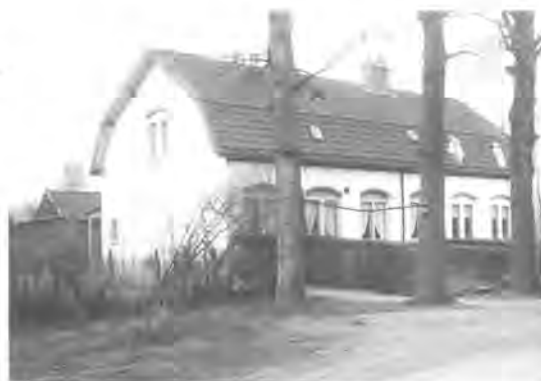
Drie arbeiderswoningen voor personeel van de familie van Boetzelaer. De woningen stonden in de oosthoek van de Leyenseweg-nu Rietveldlaan- en de Waterige Weg-nu Koldeweylaan. Afgebroken rond 1970.

Ook in de brief, gedateerd 7 maart 1972, eveneens gericht aan B.en W. en afkomstig van de Provinciale Utrechtse Stichting voor Welzijnsbevordering, getekend door directeur drs. N.F.A. de Graan, werden bezwaren geuit.