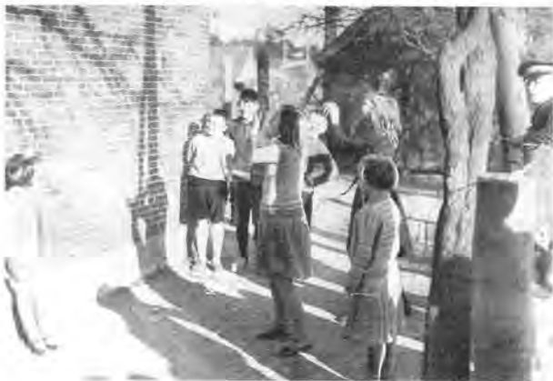
Leyenboeve, Leyenseweg 42

Blijkens punt 7 van de brief was de groep de mening toegedaan dat niet-economisch aan onze gemeente gebonden woningzoekenden in Maarssen of Nieuwegein een woning toegewezen zouden kunnen krijgen. Het aantal woningzoekenden in de gemeente De Bilt zou daardoor aanmerkelijk lager worden. Bovendien waren, volgens punt 10, de nieuw