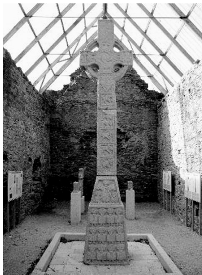
Hoogkruis van Moone, Zuidoost Ierland.

hier nog niet van de grond, elders al wel. Als voorbeelden van 'elders' noemt zij echter alleen Italië en Frankrijk (p. 194). Dat is verbazingwekkend: Ierland valt blijkbaar buiten haar gezichtsveld. Terwijl de idealen van de vita apostolica daar al eeuwen in de praktijk werden gebracht: onder St. Patrick (5e eeuw), St. Columba (Iona, 6e eeuw), ten tijde van St. Willibrord (7e eeuw) en daarna; de literatuur over de vroegmiddeleeuwse Ierse kloostertraditie is overvloedig.