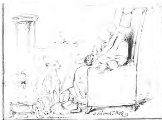
Deze aangrijpende tekening is gemaakt van de stervende Abraham baron Calkoen in het voormalige landhuis Voordaan op 4 november 1849. Calkoen overleed twee dagen later. Tekening familiearchief Calkoen.

en voortdurend aangepaste kaarten hingen tot aan de ontruiming van het gemeentehuis van Maartensdijk - als gevolg van de herindeling - in de oude en nieuwe raadzaal. Deze zijn inmiddels al ruim zes jaren in containers bij een verhuisbedrijf in Maarssen opgeslagen.