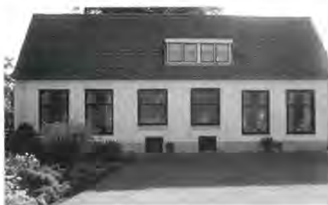
De Babel in 2005 na de ingrijpende laatste verbouwing.