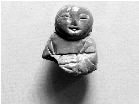
De kleine boeddha.

Het talrijkst zijn de scherven van aardewerk, porselein en tegels. Meestal zijn