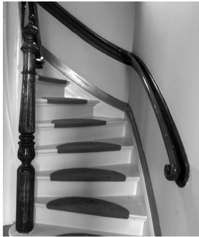
Trap in stationschefwoning.

1898 de aanstelling tot stationschef 4e klasse in De Bilt. Hij werd gehuisvest in één van de twee spoorwegwoningen uit 1862. Deze stonden op de plek van de panden van “Klein Oostenrijk”, die in 2012 afgebroken zijn. Daar woonde hij samen met zijn ouders. Tot vlak voor de sloop hebben spoorwegwerknemers in de woning gewoond.