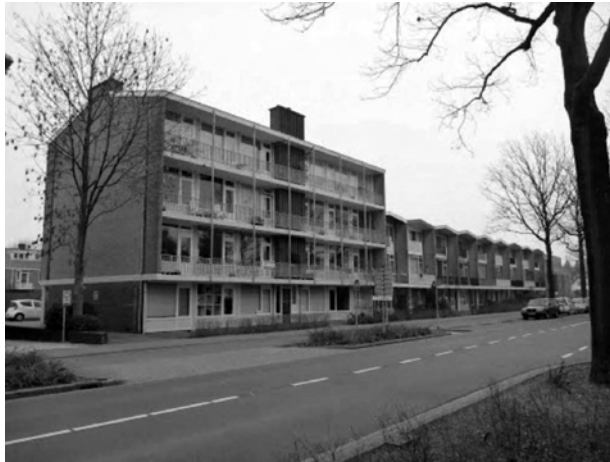
Afb. 8. Bieshaar. complex Groenekanseweg.

Hoe dan ook, het ontwerp uit 1961 is uiterst modern. Het luidt, na de jaren waarin de Biltenaren met de naweeën van de Tweede Wereldoorlog te kampen hadden, een nieuw tijdperk in. Niet beter kon het einde van de Wederopbouw gesymboliseerd worden dan met dit ultramoderne woonblok met comfortabele flats en ruime drive-in-woningen met drie woonlagen die door een luxe mahoniehouten spiltrap verbonden zijn. De oude bouwmeester had inmiddels het stokje aan Robert Magnée overgedragen. Al vanaf het begin van de activiteiten in De Bilt stond hij Dudok terzijde, maar voor het eerst treedt Dudoks assistent met dit project nu ook als ontwerper naar voren.