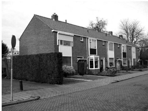
Afb. 6. Bieshaar.

Intussen was Plan Bieshaar al een heel eind op streek. Dit wijkje, dat maar weinig Biltaren zullen kennen, ligt verborgen in de hoek die de Groenekansweg met de Eerste Brandenburgerweg maakt. Toch is het een stedenbouwkundig juweeltje van Wederopbouwarchitectuur dat bewonderaars tot uit Japan trekt (afb. 6).