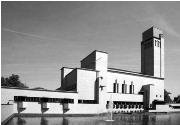
Afb. 2 Raadhuis Hilversum.

Dudok ging pas in 1954 op zeventigjarige leeftijd met pensioen, maar zelfs toen had hij er nog niet genoeg van en ging als zelfstandig architect gewoon door. Zelfs als tachtigjarige was hij nog volop aan het werk, zo vertelt hij in een interview ter gelegenheid van het bereiken van die leeftijd, al kon hij toen niet meer het geduld opbrengen om zijn ontwerpen tot bouwtekeningen uit te werken. Dat liet