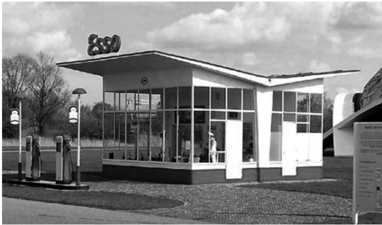
Afb. 3. Esso-pompstation.

luchtigheid doorgevoerd in zijn ontwerp voor het Esso-pompstation uit 1954 (afb. 3).