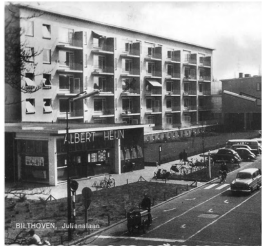
Afb. 1 Julianacomplex ca.1961.

Aan de Julianalaan bij station Bilthoven ligt een complex van Dudok uit de jaren vijftig van de vorige eeuw (afb. 1). Algemeen bekend is dat de Julianaflat van deze beroemde architect is, maar minder bekend is dat ook het lage deel, waarin nu de Bilthovense Boekhandel is gevestigd en dat in het kader van het Masterplan Centrum Bilthoven met afbraak wordt bedreigd, eveneens door Dudok is ontworpen. Nog minder bekend is dat in De Bilt nog meer architectuur op naam van Dudok staat, waaronder zelfs een hele wijk. Alle redenen om aandacht te schenken aan deze bijzondere architectuur. Het betreft drie objecten: een particuliere woning aan de Albert Cuyplaan, het Julianacomplex en Plan Bieshaar.