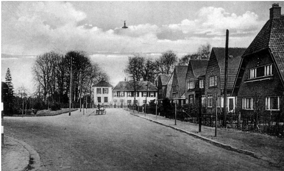
Afb. 7 Meijenhagen 1925-30. Ansichtkaart uit de collectie van de Historische Kring D'Oude School.