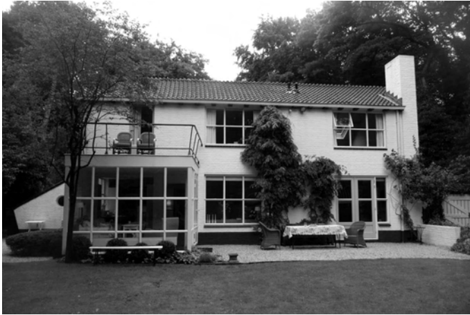
Afb. 4. Albert Cuyplaan 37.

Baarn, geeft Dudok aan dat de muren wit gekeimd worden. Dat gebruik van de minerale keimverf in plaats van de voor Dudok gebruikelijke gele baksteen is opmerkelijk en zal verband houden met de nog heersende schaarste. Daarmee houdt ook verband dat het huis op de begane grond slechts één ongedeelde woonruimte kreeg en op de verdieping slechts één slaapkamer, want