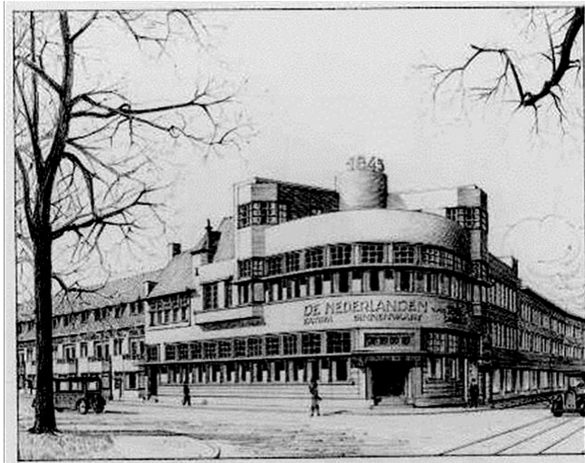
De Nederlanden van 1845, Nagtegaalstraat, Utrecht.