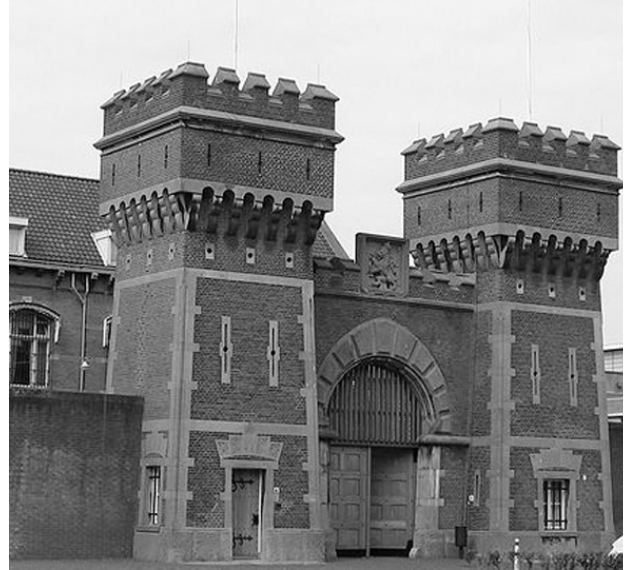
De Scheveningse gevangenis, het Oranjehotel.

Begin 1943 werd hij overgebracht naar Haaren in Noord-Brabant, waar hij bijna een halfjaar op zijn proces moest wachten. De bezetter wachtte tot ze genoeg ‘Todeskandidaten’ hadden. Het was dus niet verwonderlijk dat