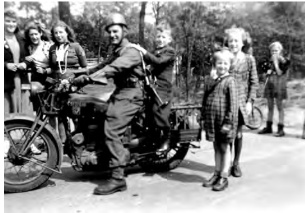
Foto kort na de bevrijding in mei 1945 genomen in het stuifduingebied met begroeiing waar nu centrum 2 ligt. Daar was een groot complex met legententen neergezet. Ik was toen 10 jaar.

Vader had al jaren contact gehad met een mijnheer Flapper in Slagharen. Die woonde in een gebied met voldoende voedsel. Je moest