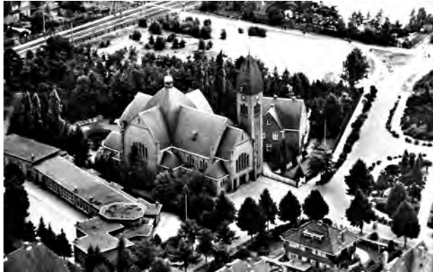
De kerk Onze Lieve Vrouwe van Altijddurende Bijstand. Links de Theresiaschool.

speelden, kwamen er ineens een paar Duitse overvalwagens aanrijden. We schrokken ons een ongeluk en dachten dat ze naar de kerk zouden gaan voor dat 'Wilhelmus'. Ze gingen echter richting Obrechtlaan en reden daar de tuin van het huis van Sickenga in. Wij maakten benen. Later hoorde ik dat in dat huis een illegale radiozender zat. Het had iets te maken met het Engelandspiel, Geen notie wat dat was. Een van de data die ik nooit zal vergeten ben was 15 augustus 1944. Een prachtige zomerdag. Je hoorde het langzaam dichterbij komend geluid van vliegtuigen. Nu kwamen er vrij laag heel veel grote vliegtuigen over in de richting van Soesterberg. Iedereen stond buiten te kijken. Overal vond je van