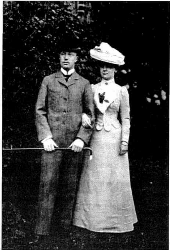
1900: Verloving van koningin Wilhelmina met Hendrik Wladimir Albrecht Ernst, hertog van Mecklenburg op 16 oktober.

Een genoegzaam aantal exemplaren dezer aanschrijving gaat te dien einde hiernevens”.