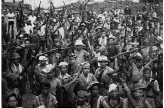
Zegevierende Indonesische guerilla-strijders.

Dorren, C.J.O. “Onze Mariniersbrigade (1945-1949)”. Een veelbewogen episode in de korpsgeschiedenis. 's-Gravenhage, z.j.