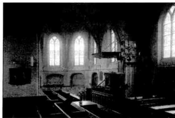
Interieur van de kerk met links de portretten.