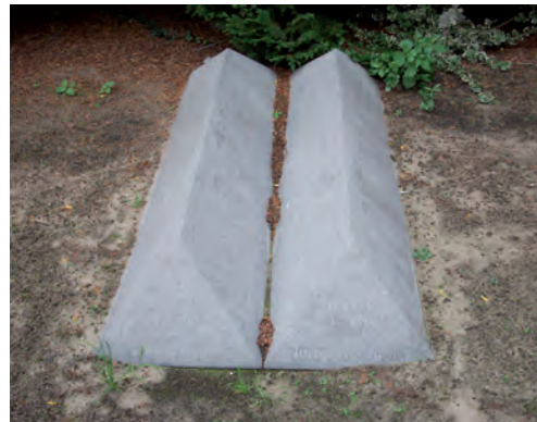
Dubbel graf met sarcofagen.

boog. Een aantal uit baksteen gemetselde grafmonumenten, waarvan een in de jarentwintigstijl en een met een aangebracht mozaïek, vallen eveneens op. Tenslotte is een dubbelgraf in de vorm van twee hardstenen