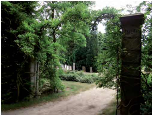
Oude ingang kerkhof.

De begraafplaats Brandenburg is in 1900 in gebruik genomen en bestaat dus nu ruim een eeuw. Wie over deze dodenakker wandelt, krijgt niet alleen een aardig beeld van de diverse fasen in de grafcultuur, zoals de tijdgebonden vorm en versiering van grafstenen, maar evenzeer van de verscheidenheid aan persoonlijke en/