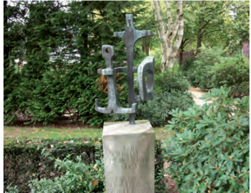
Geloof, hoop en liefde..

Algemene symbolen voor liefde en trouw zoals een hart en gekruiste ringen en ineengrijpende handen treffen we aan, evenals de vijf- en achtpuntige ster, in de Christelijke symboliek een verwijzing naar Christus, naar nieuw leven en naar de hemel, en de zon als symbool voor zowel de beëindiging van het leven als de wederopstanding. Een bel op een graf roept op tot aanbidding. Andere Christelijke symbolen zoals het anker voor hoop, en meestal in combinatie met hart en kruis als de drie-eenheid van geloof, hoop en liefde, ontbreken evenmin op Brandenburg. De kroon met een kruis, vooral in katholiek Nederland bekend, heb ik eenmaal aangetroffen, evenals het zonnewiel. Het eerste is het symbool van de beloning in de hemel (de kroon) na de beproevingen