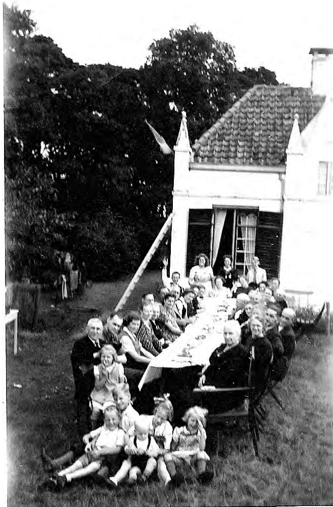
Opa en oma Van Bovenend zijn 40 jaar getrouwd.

'Wij wisten niet dat de oorlog was uitgebroken,' vertelt hij. 'Mijn vader werkte toen op de plaats en mijn opa ook. Daar kwamen ze tot de ontdekking dat alles en iedereen weg moest. Boer Van Laar had