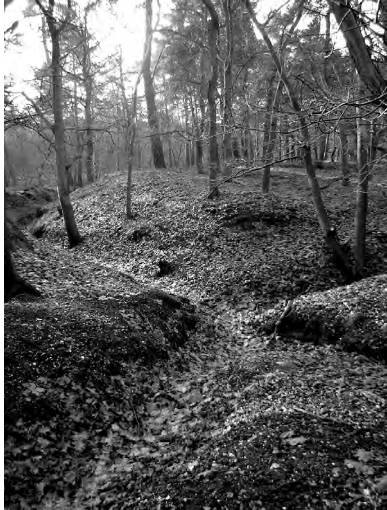
De greppels bij de voormalige wel.

Van Bovenends opa en zijn moeder zijn in het huisje op Vollenhoven geboren. ‘In 1952 ben ik naar de Tuinstraat verhuisd. In 1958 is er stroom