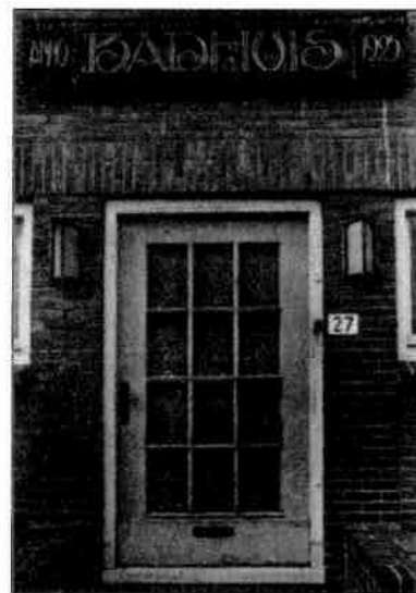
Badhuis na sluiting.