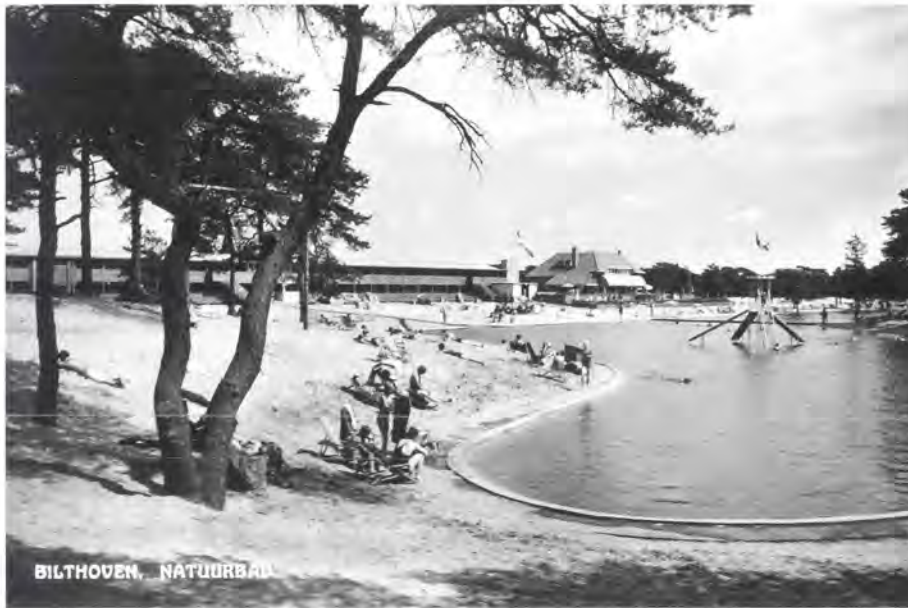
De sierlijke aanleg van het natuurbad „De Biltse Duinen”.