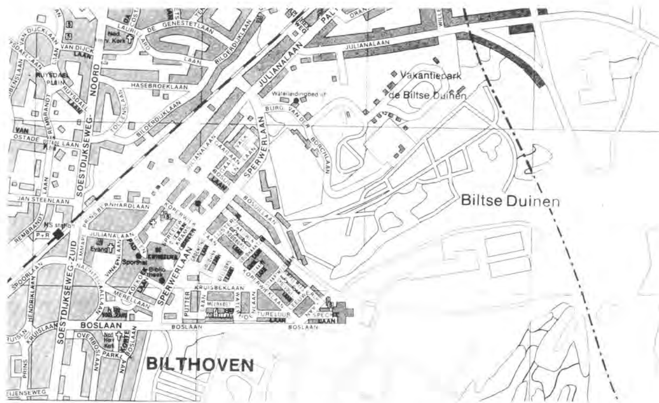
Plattegrond met de ligging van de „De Biltse Duinen” en de „Molshoop” nabij de woonwijk Bilthoven Centrum II.

bewoners grond te verkopen voor de uitbreiding van hun tuin. In het koopcontract wordt wel een boeteclausule van 500.000 gulden opgenomen met de bepaling dat deze bewoners voortaan geen bezwaar zullen aantekenen tegen de aanleg van een golfbaan. Zo raken de Vrienden hier enige medestanders kwijt.