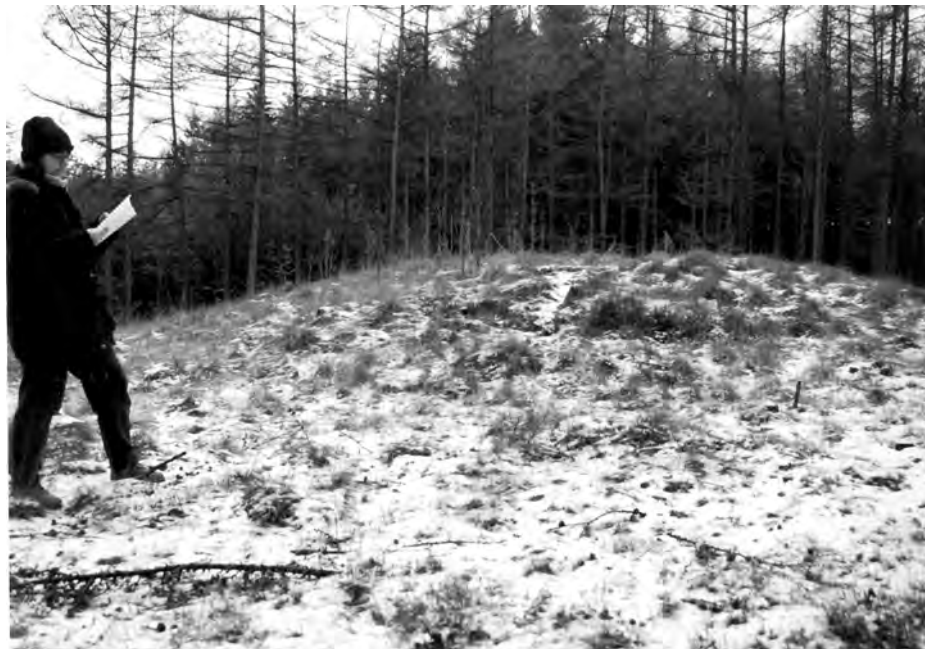
Met sneeuw bedekte grafheuvel in Lage Vuursche. Januari 1998.

speelden in grotere of kleinere mate een rol: (bloed)verwantschap, de relatie tot de heer en de (dorps)gemeenschap. Omdat de heren niet de middelen hadden om direct individuen te sturen, waren de verschillende sociale relaties belangrijk om de samenleving te bereiken. De vroege Middeleeuwen waren het tijdperk van de sterke persoonlijkheden, van de weigering tot abstractie en ruime horizonten (of anders gezegd: de horizon was beperkt), van kleine groepen en een warmbloedig gemeenschapsleven. Geloof en de dood speelden een belangrijke rol (Rouche, 1992). Rond 1000 was de bisschop van Utrecht de machtigste man van Nederland; de Duitse keizer, bestuurde 'op afstand'. Wel kwam hij af en toe zijn leenman, de bisschop, opzoeken en de toenmalige Biltenaren zullen zich vergaapt