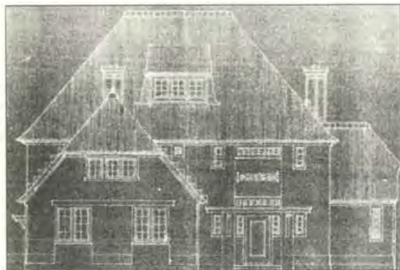
Sonnenberg / Klein Dubbelzes, Beethovenlaan 10

vermoedelijk op dit adres haar Christelijke MULO-opleiding. Toen er in juli 1947 nog een tiental meisjes bij kwam werd dit waarschijnlijk teveel om die allemaal op een beetje redelijke manier in dit huis onder te brengen.