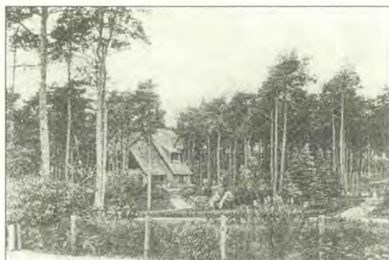
De Dennenhut, Beethovenlaan 7

Waarom deze villa de huisnaam De Dennenhut mee kreeg, ziet u op bijgaande oude foto, een riante ligging midden tussen de dennenbomen.