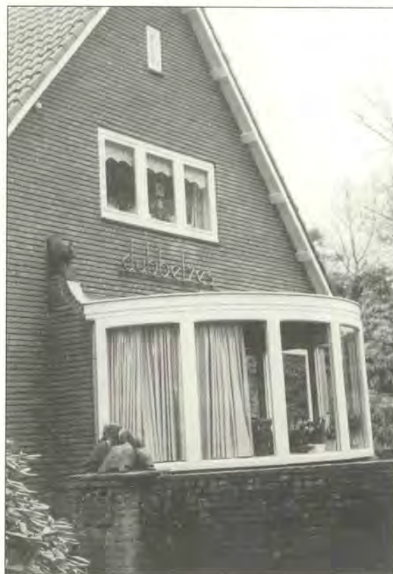
Voorgevel en huisnaam 'Dubbelzes'