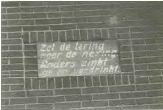
Bord met spreuk Spoorlaan 60