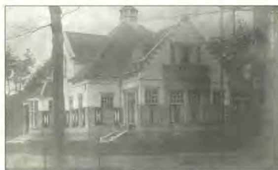
Trinari