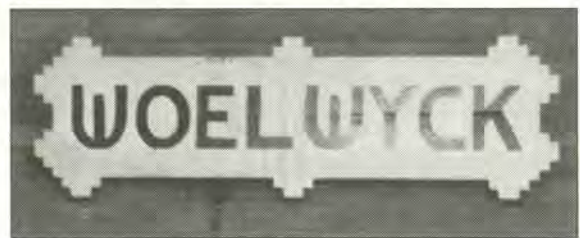
Vroegere naambord op achtergevel

De villa Woelwijck blijkt niet het enige pand te zijn dat de bouwer J. Klaver in dit gebied in hoog tempo deed verrijzen naar ontwerp van architect C. Schoffels uit Utrecht. In het jaar 1920 verkreeg hij bouwvergunningen voor de nu ook nog bestaande villa's op de huidige huisnummers 84, 90 en 92. Deze panden dragen helaas geen huisnamen.