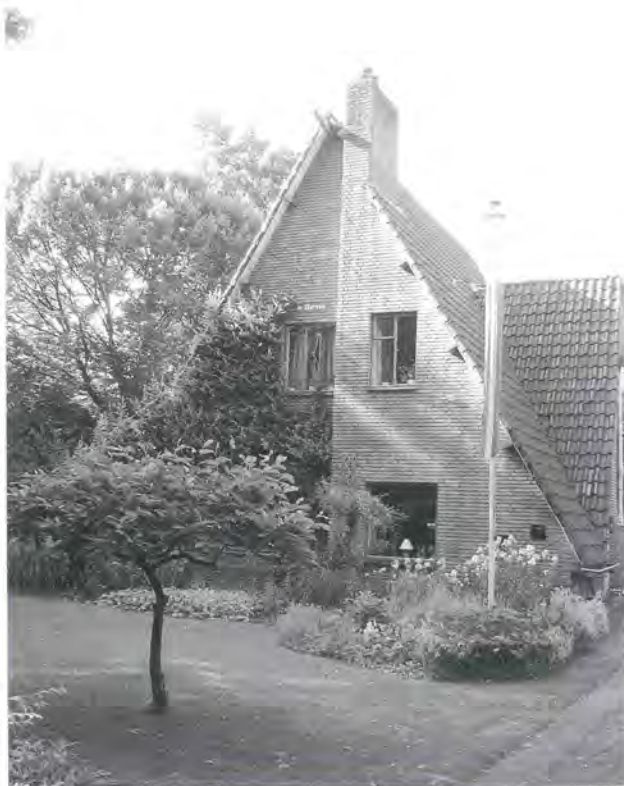
De Baronie, De Hoogblaan 9.