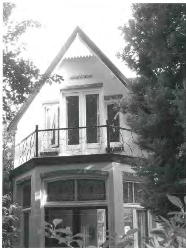
Villa Maria, Bilderdijklaan 58.