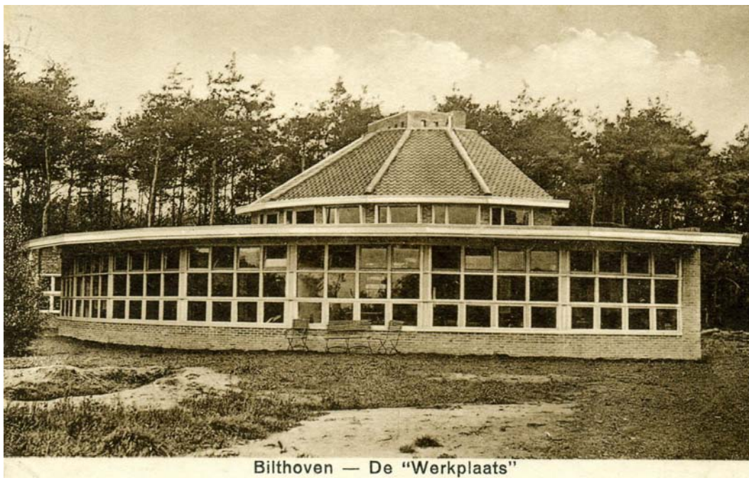
De Werkplaats aan de Frans Halslaan in Bilthoven.