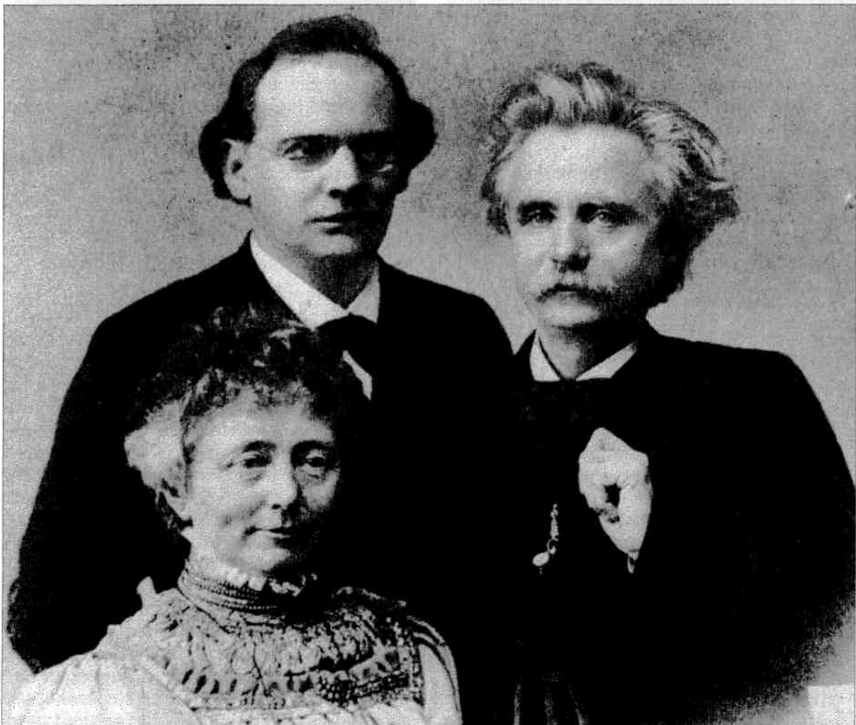
Julius Röntgen en het echtpaar Edvard en Nina Grieg.