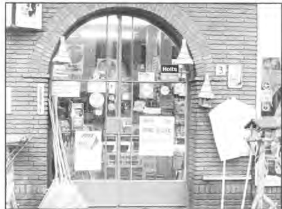
Winkelingang in de vijftiger jaren

De winkel is, ondanks de bombardementen rond het station, de oorlog zonder schade doorgekomen. Tijdens de oorlogsjaren maakte de dansschool van de heer Sparretak op