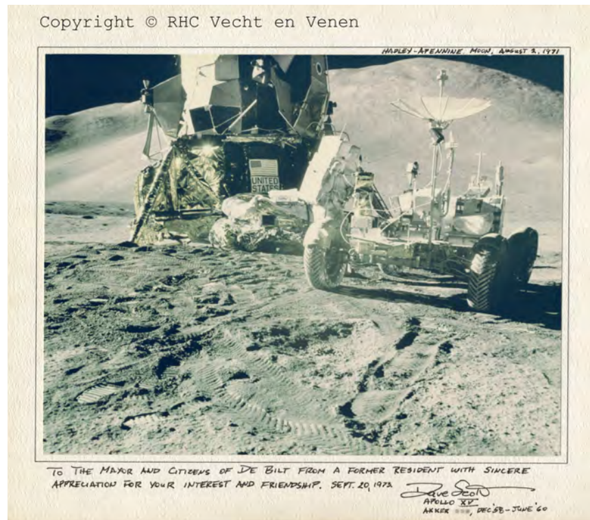
Bedankje van David Scott aan de gemeente De Bilt en haar inwoners.

Die foto is het ultieme bewijs van de juistheid van het adres, zoals ik dat eerder aangetroffen had in de Telegraaf van 5 maart 1969. Scott en twee collega's vlogen toen rondjes om de aarde in de Apollo 9, als voorbereiding op de eerste maanlanding van de Apollo 11. Een journalist had een bezoek gebracht aan de vliegbasis Soesterberg en had daar