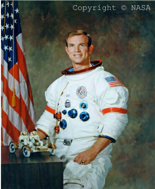
David R. Scott, commandant van de Apollo 15, klaar voor de maan: zijn derde, tevens laatste, ruimtevlucht.