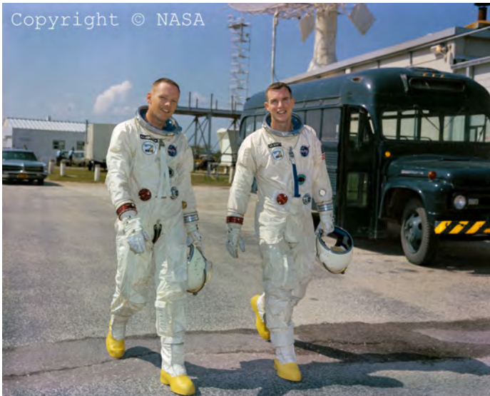
Maart 1966: Neil Armstrong en Dave Scott (rechts) kort voor hun eerste ruimtevlucht met de Gemini 8.

Gezien mijn eigen ervaring met Amerikanen van vliegbasis Volkel vermoedde ik van wel, maar vooralsnog ontdekte ik in dit geval enkel en alleen het bestaan van de Amerikaanse woongemeenschap Camp New Amsterdam, die zich op vliegbasis Soesterberg zelf bevond. In de jaren 70 werd deze uitgebreid met een, buiten de basis gelegen, nieuwe Amerikaanse wijk. Deze had klinkende straatnamen als Apollo, Gemini en Mercury.