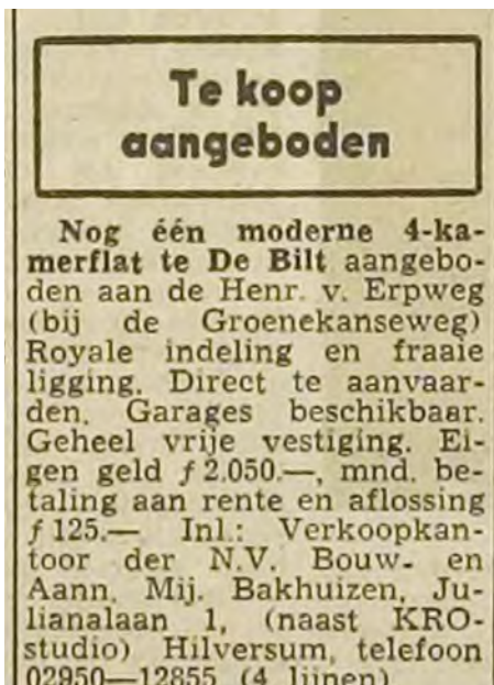
November 1958: een Bakhuizen-advertentie uit een editie van het Dagblad voor Amersfoort.