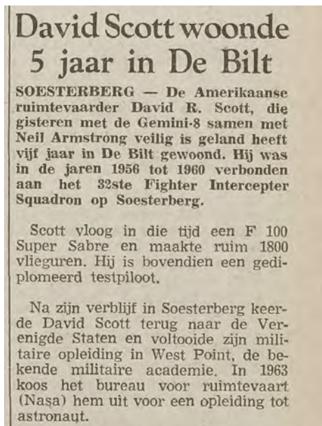
Utrechtse Nieuwsblad van 17 maart 1966.