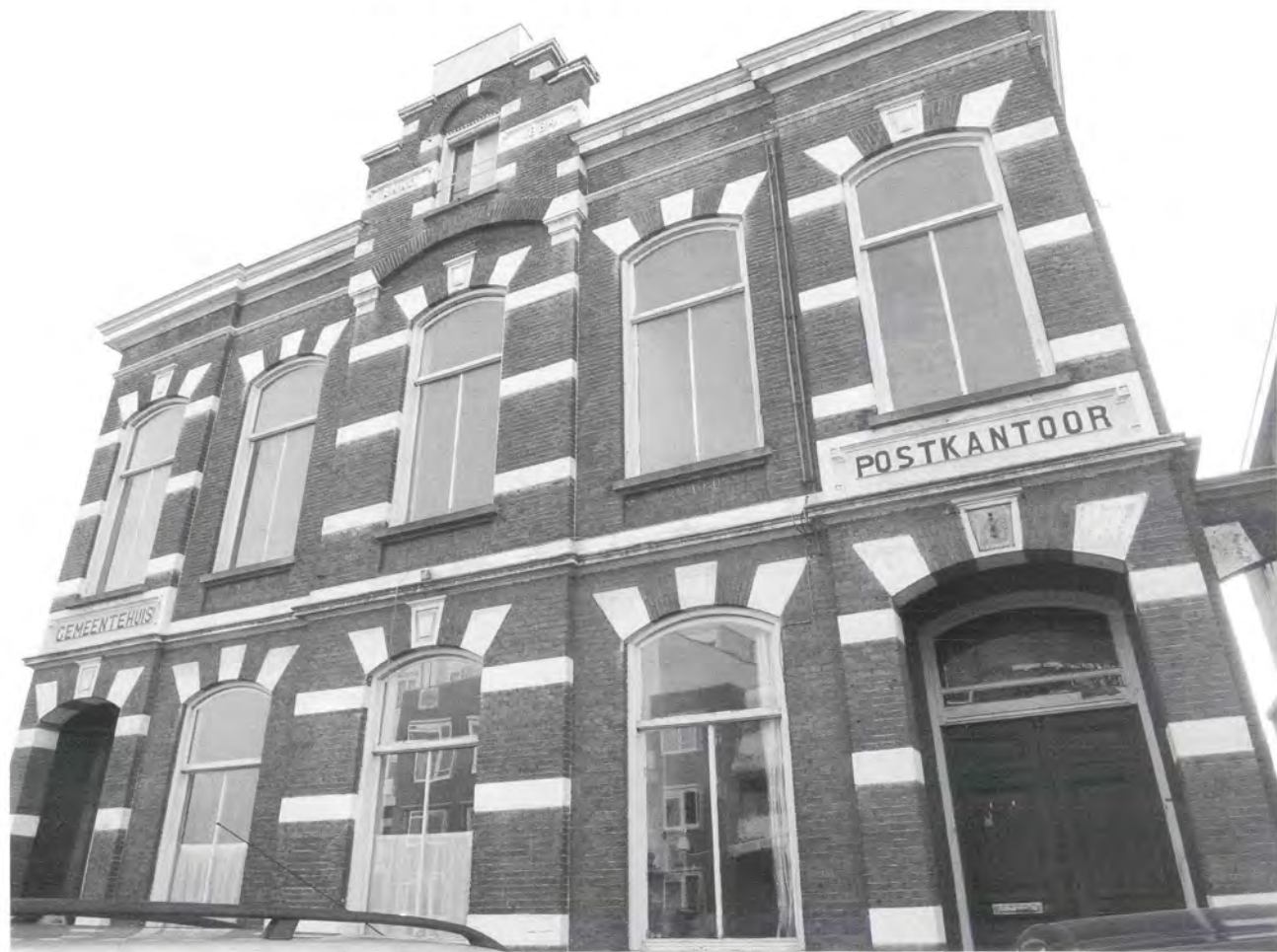
Dorpsstraat vanouds Steenstraat 25