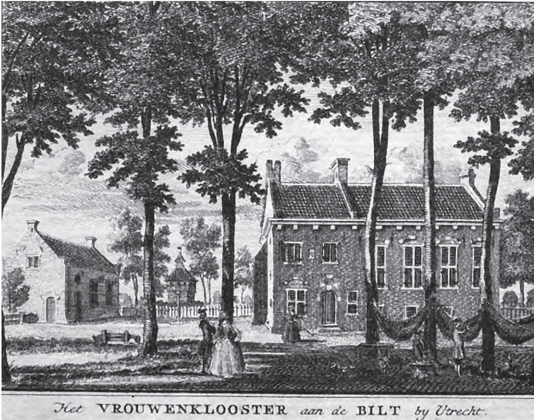
Vrouwenklooster collectie Historische Kring D'Oude School.

De oorlog laaide weer op in de late jaren 1520, toen bisschop Hendrik van Beieren een laatste maar uiteindelijk vergeefse poging deed om de zelfstandigheid van het bisdom te handhaven, waarbij de stad Utrecht hem hinderlijk voor de voeten liep. In maart 1527 liet de bisschop tweehonderd gewapende mannen uit Amersfoort naar De Bilt