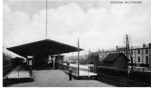
Station Bilthoven 1920.

Ruim drie decennia later werd als zijtak van deze lijn door de Utrechtsche Locaalspoorweg Maatschappij een spoorweg vanaf Den Dolder naar Soest en Baarn aangelegd. Vanaf 1898 reden de treinen van de N.C.S. vanaf Utrecht naar Baarn en maakten het forensen gemakkelijk in de stad Utrecht te werken. In 1901 nam de N.C.S. een tweede lokaalspoorweg in gebruik, aangelegd