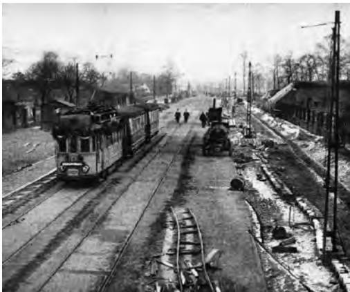
Eerste NBM-tram door het fort De Bilt op 5 december 1930.

Voortbordurend op het oeroude verbindingennet binnen onze gemeente kwam in 1937 de rijksweg (die vanaf 1964 Utrechtseweg zou gaan heten) tot stand. Decennia later nam de A28 de zware verkeersdruk die gaandeweg meer op deze weg ging rusten, weg. In de jaren twintig en dertig van de vorige eeuw werden, onder meer door een zekere ingenieur Anton Mussert reeds voorbereidingen getroffen voor de A27, die de groei van het verkeer over de Tolakkerweg en Koningin Wilhelminaweg op moest vangen ... Op het moment dat ik dit schrijf zijn deze laatste rijkswegen beruchte filewegen geworden en zitten er weer aanzienlijke veranderingen in het vat. Delen van de gemeente