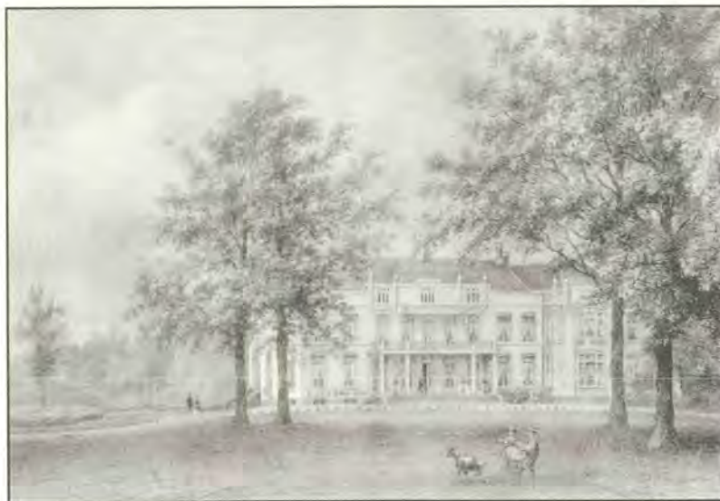
Jagtlust in de vroeg 19e eeuw

(Vervolg van het artikel in een volgend nummer)