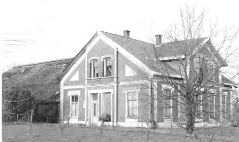
Bureveld 2, Bunnikseweg 10 in 2007.

mijn leven ervan afhing. En in dit geval was dit nog volledig waar ook. In geen tijd waren we klaar en we voelden beiden, dat het tussen ons klikte. Ik vertelde Jitze over mijn situatie en hij vertelde, dat zijn vrouw Joke zwanger was en zich vaak niet lekker voelde. Een hulp zou zeker welkom zijn, maar hij moest de gehele situatie toch eerst met zijn vrouw en zijn ouders bespreken. Hij zou vooruit fietsen en ik zou met de