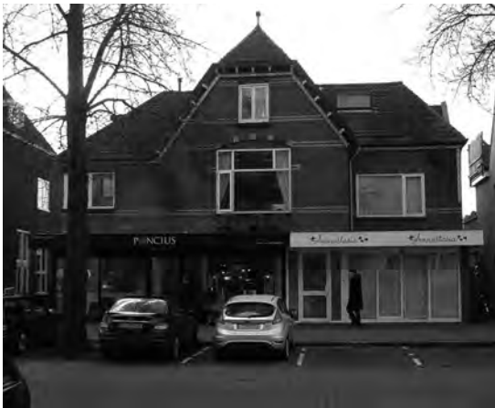
Het pand vlak voor de sloop.

Bron : Archief Historische Kring d’Oude School; met name diverse aantekeningen van Jan van der Heyden.