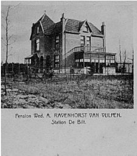
“Pension Wed. A. Ravenhorst Van Vulpen. Station De Bilt” is waarschijnlijk uit dezelfde jaren. Vergelijk de westgevel met de tweede tekening hiervoor om een indruk te krijgen van de uitbreiding.