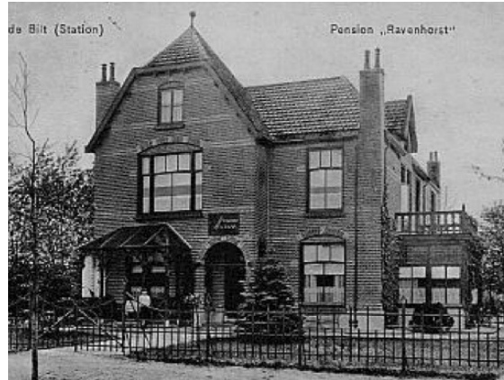
“De Bilt (Station) Pension “Ravenhorst”” is van 1912. Boven de ingang staat de naam van het pension. Opzij is de uitbreiding te zien. De jongen voor het huis is zeer waarschijnlijk zoon Aart, die in 1903 geboren werd, anderhalve maand na de dood van zijn vader.