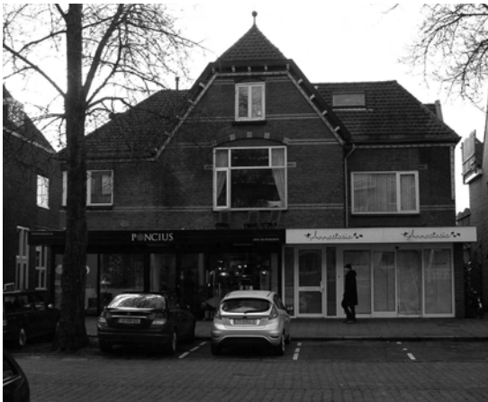
Het pand vlak voor de sloop.