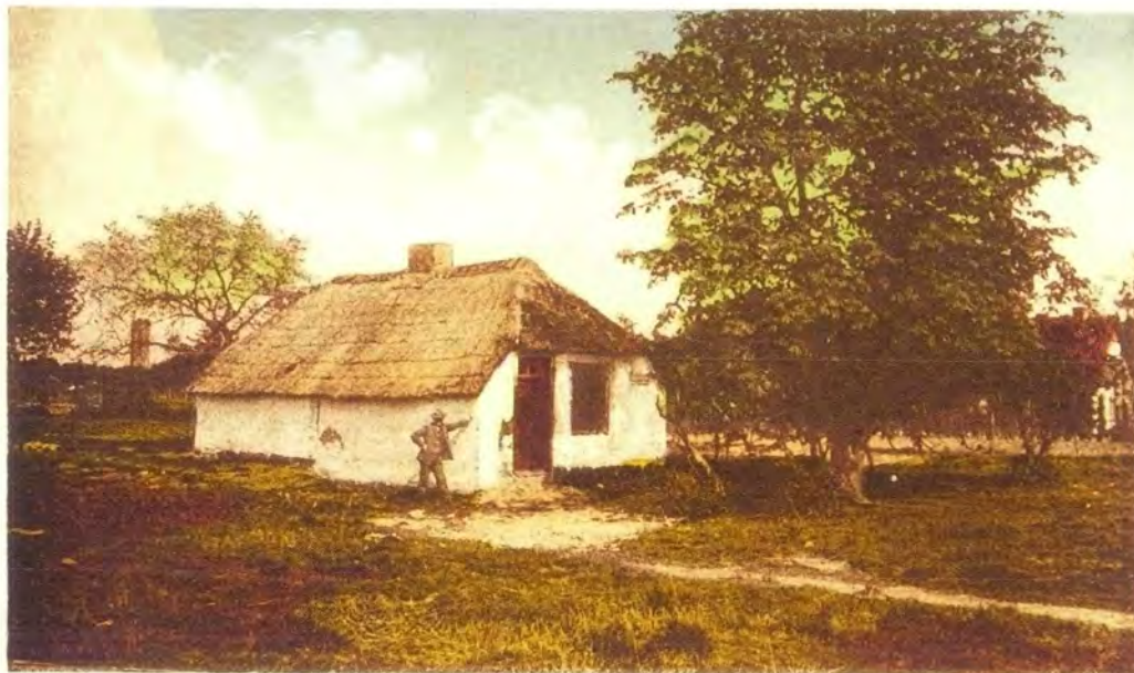
Huisje o/h Jodendom