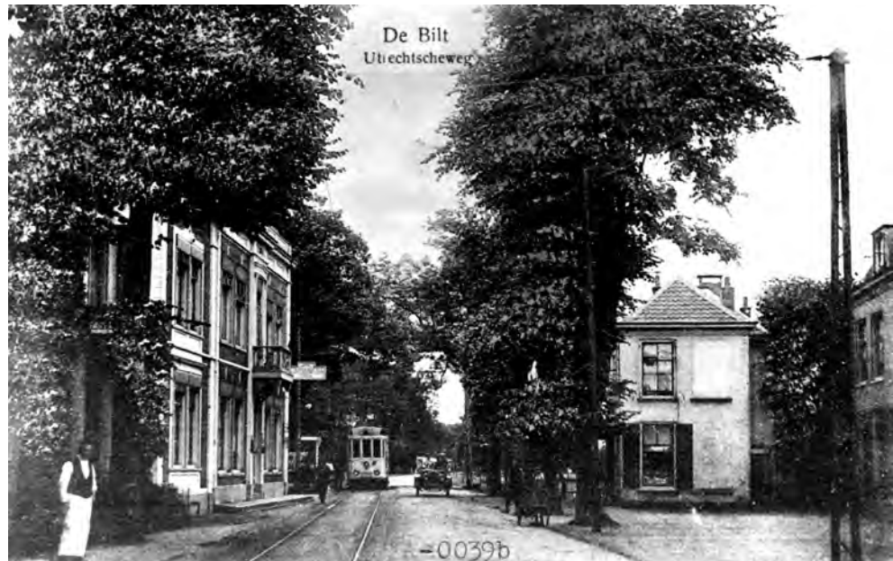
De Bilt, Utrechtseweg 1910

Het duurde nog tientallen jaren voordat er weer een officieel besluit over naamgeving door de gemeenteraad genomen werd. Dat gebeurde op 28 april 1964. In de aanhef van dat besluit staat het volgende: 'Overwegende, dat het wenselijk is aan de Utrechtseweg, voor wat betreft het