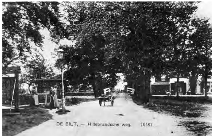
De Bilt, Kapelweg/Hillebrandsche weg

De in zuidelijke richting lopende zijweg van de Dorpsstraat vanouds Steenstraat kennen we tegenwoordig als Kapelweg. Uit de Legger der Wegen in de gemeente De Bilt 1885-