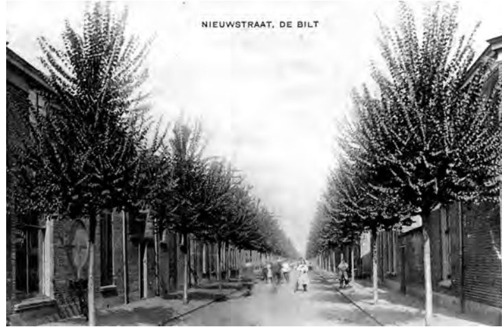
De Bilt, Nieuwstraat

In het al vaak genoemde naamgevingsbesluit