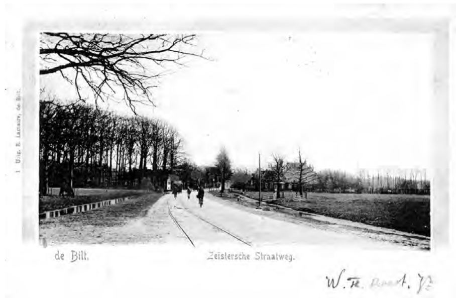
De Bilt, Holle Bilt/Zeistersche Straatweg

Met ingang van 1 oktober 1964 zouden de volgende namen officieel gaan gelden: a. Utrechtseweg aan de in het rijkswegenplan als "rijksweg 25" aangeduide weg, voorzover gelegen op het grondgebied van de gemeente De Bilt, van de Bilthovenseweg af tot de grens met de gemeente Zeist, zoals in rode kleur is aangegeven op de bij dit besluit behorende situatie-tekening; b. Steenstraat aan de weg gelegen in de