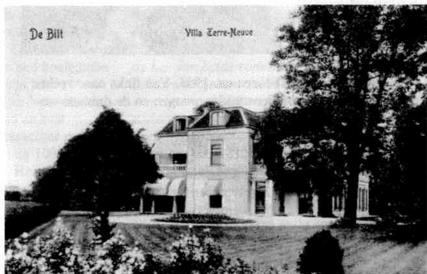
Villa Terre Neuve 1907. Uiterst links nog bouwland waarop in 1926 de Bilthovenseweg werd aangelegd.