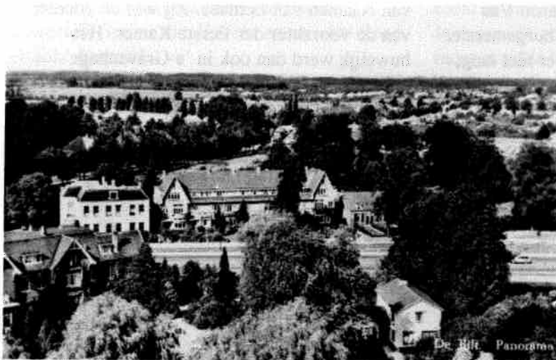
Gezicht vanaf de KNMI-toren ca. 1965. Van links naar rechts Terre Neuve, de rij middenstandswoningen en de dubbele woning.

Terre Neuve en Vredenhof werden verkocht aan de "N.V. Bouw- en Exploitiemaatschappij Terre Neuve te De Bilt". Dit luidde het einde in van het koetshuis, de in 1907 gebouwde personeelswoning en de villa Vredenhof. Hier werd in 1930 een rij van zeven middenstandswoningen gebouwd, de huidige Dorpsstraat 114-126.