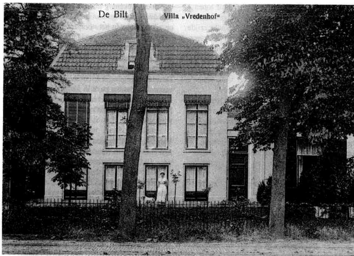
Villa Vredenhof 1910.