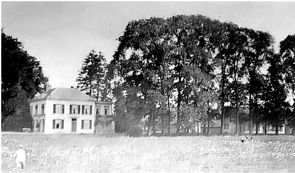
Villa Den Eijck, het verdwenen buitenhuis bij de overplaats van Vollenhoven, gezien vanuit het zuiden. Rechts boerderij Den Eijck, die er nog steeds staat. De foto stamt vermoedelijk uit de dertiger jaren van de vorige eeuw.

overplaats. Pothoven voegde er een tekening bij, maar die is niet in het huisarchief aanwezig. Volgens Pothovens opgave zouden bij de villa de kap, de zuidgevel en een deel van de achtergevel worden weggebroken en weer opgebouwd, waarbij een mangelkamer,