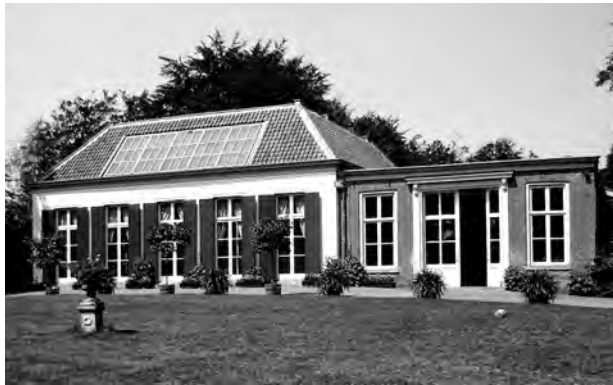
De oranjerie met de ruiten in het dak en aan de rechterzijde de aanbouw uit 1858 door Hendrik Pastunink.

Een ander project uit 1858 dat op naam van Pastunink staat, betreft de aanbouw aan de oranjerie. De oranjerie is rond 1805 gebouwd, in de stijl van het grote huis. Pastunink zette er aan de rechterzijde een bijgebouwtje tegenaan, maar niet in dezelfde stijl. Ook ontbreken de luiken die zo kenmerkend voor de vroege