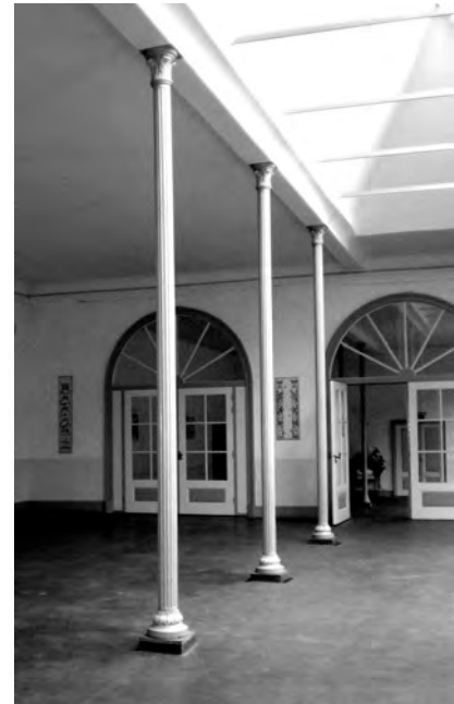
Het oude deel van de oranjerie, met de verhoging in het dak rechts en drie van de vier gietijzeren zuilen uit 1850. Achter de deuren de aanbouw van Pastunink uit 1858, door de open deur is nog net een van de twee zuilen daar te zien. De oranjerie is in 1998 gerestaureerd. De deuren onder de boogvensters zijn een paar jaar geleden geplaatst

gebouwen op het landgoed zijn. De aanbouw is bovendien het enige stenen gebouw op Vollenhoven dat geen witte buitenmuren heeft, wat het verschil met de eigenlijke oranjerie nog onderstreept. Voor zover bekend zijn de muren van de aanbouw ook nooit wit geweest. De vloer van de aanbouw ligt lager dan die van de oranjerie, een paar treden leiden van het ene stuk naar het andere. Tussen de twee