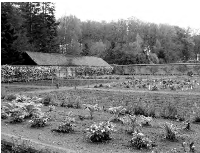
Muren rond de oude broeierij in de moestuin. Links de oostmuur, met daarachter het dak van de houtschuur. De rechtermuur wordt gevormd door de achterwand van een oude druivenkas.

De broeierij was het gedeelte van de moestuin waar planten gekweekt werden die warmte nodig hadden. Hier stonden de kassen en koude bakken, de schuttingen droegen bij aan het gewenste klimaat en konden bovendien dienen als steun voor vruchtbomen. Op Vollenhoven werd de noordelijke helft van de moestuin als broeierij gebruikt; een wetenschap die we opnieuw danken aan Kluppel, die hierover een