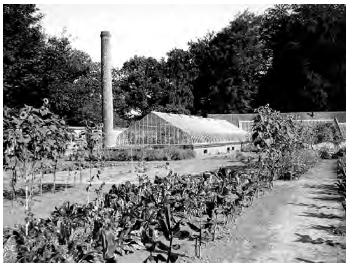
De ronde "bloemenkast" die Kluppel in 1852 liet bouwen. Aan de voet van de schoorsteen bevindt zich een lage stookkamer. Dwars op de achtergrond staat de oudste warme kas in de moestuin, gebouwd vóór 1848. Beide kassen zijn een aantal jaren geleden gerestaureerd.

vermeld. 2 De veilingcatalogus van 1848 noemt 'eene warme kast', die te identificeren is met de kas die haaks achter de ronde kas staat. De nieuwe kas was bestemd voor bloemen. Uit Kluppels schrift is ook op te maken welke dat waren: orchideeën. In 1853 en 1854 werden er bijna honderd orchideeënmandjes besteld, in november 1855 kocht Kluppel op een veiling te Utrecht een aantal orchideeën, waaronder een aantal exemplaren van de Dendrobium