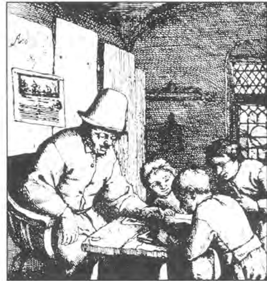
Het overboren van leerlingen Ets van A. van Ostade, 17 e eeuw, Rijksmuseum Amsterdam

Een paar kilometer verderop leek het in 1593 al weinig beter gesteld met de waarden en normen. Rogier meldt: „Een groot dronkaard heet de paap Hendrik Hendrikszn, die zich te Westbroek ophoudt.” Toch lijkt deze Westbroekse predikant al redelijk ‘gereformeerd’, want op school gebruikte hij de kleine catechismus van Maarten Micron, getiteld: Corte Ondersouckinge des ghelooves over den ghenen die haer tot de gemeynte begheven ende des Heeren avondmael met haer willen houden.