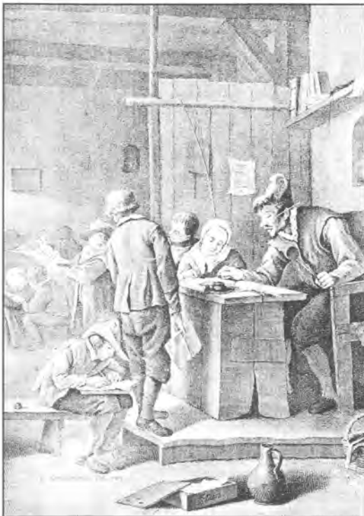
Schoolinterieur in de 17 e eeuw.

Gravure van N. van der Meer naar een schilderij van Jan Steen, Rijksmuseum Amsterdam.