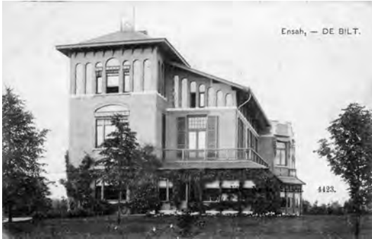
Villa Ensah.

naam die bedoelde horecagelegenheid gedragen heeft.