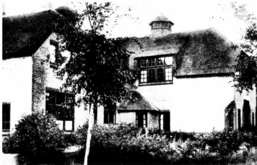
Broederschapshuis in Bilthoven (1928).