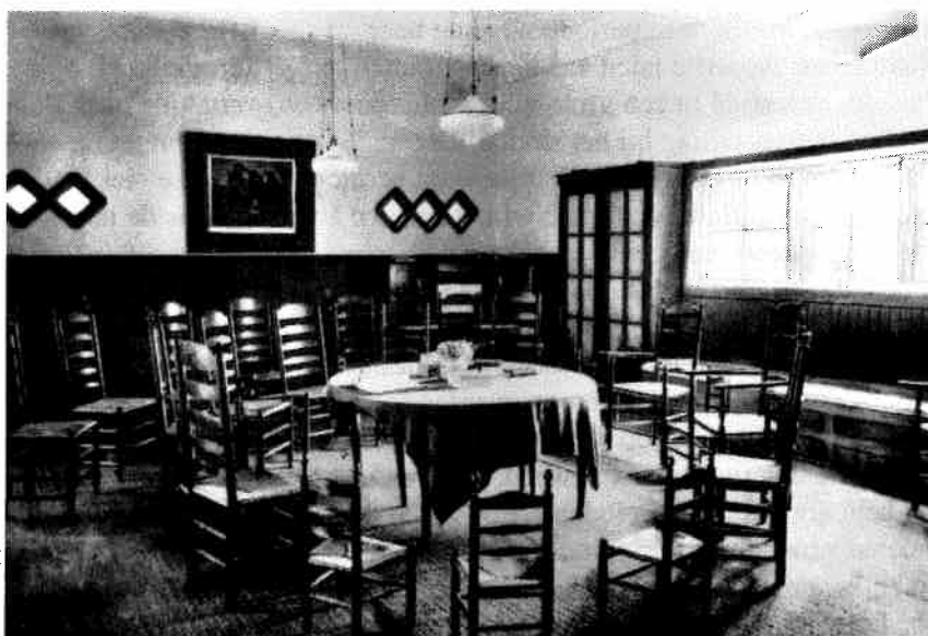
Vergaderzaal van het Broederschapshuis (1928).